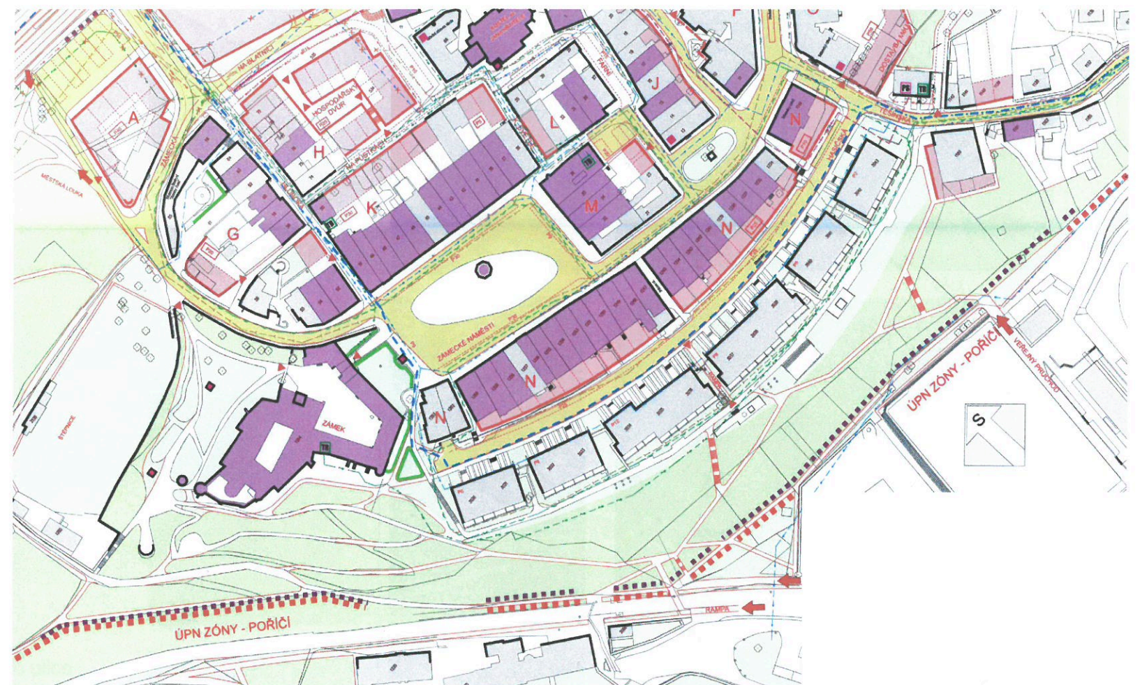
(Městská památková zóna Frýdek, ADI Design Hradil, Ostrava 2002)

Řešené území (vyznačeno červenou čarou) je v Územním plánu zařazeno do funkčního typu veřejná zeleň. Část území je spolu se Zámeckým parkem navíc vyhlášena Významným krajinným prvkem. Limitou území je a jeho průchodnosti je průběh železniční trati, který významně omezuje pohyb územím jižním směrem a spolu s plochou sportovní vybavenosti tvoří významný prostorový blok v území. V současné době jsou celé území i návazné plochy provozně obtížně průchodnými.